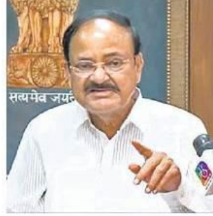
మాట్లాడుతున్న ఉప రాష్ట్ర పతి వెంకయ్యనాయుడు