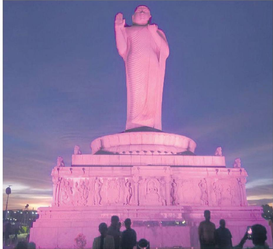
The Ushalakshmi Breast Cancer Foundation on Thursday illuminated Buddha Statue at Hussain Sagar in pink as part of an awareness programme.