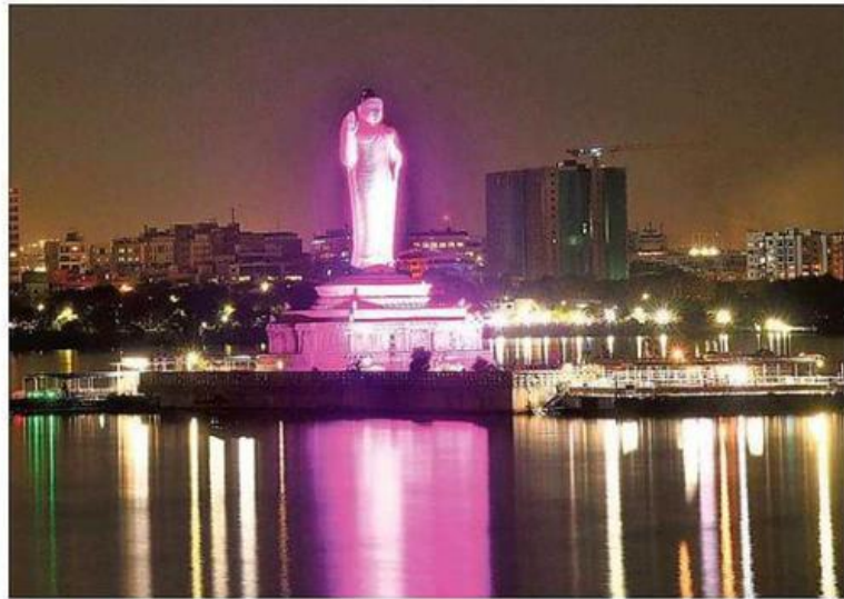
Pink mission: The Buddha statue is being illuminated in pink to create awareness about breast cancer as part of International Breast Cancer Awareness Month (October) at the Hussainsagar on Thursday.