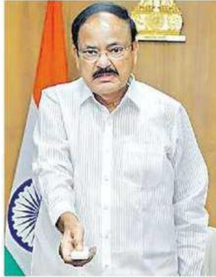
హెల్త్లైన్ను ప్రారంభిస్తున్న ఉపరాష్ట్రపతి ఎం.వెంకయ్యనాయుడు